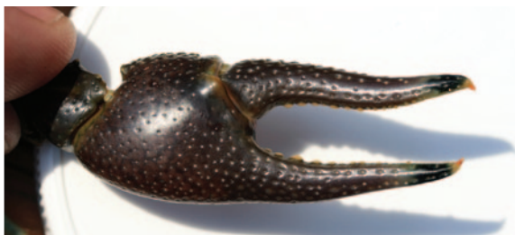
Pinces d'écrevisse américaine avec des bandes noires près des extrémités.

L'écrevisse américaine peut être confondue avec d'autres espèces indigènes vivant en Ontario, dont l'écrevisse à rostre caréné ( O. propinquus ) et l'écrevisse à pinces bleues ( O. virilis ), ainsi qu'avec une espèce introduite, l'écrevisse obscure ( O. obscurus ). Aucune de ces espèces n'a un rostre rétréci, des bandes noires sur les pinces et des taches rouille sur la carapace.