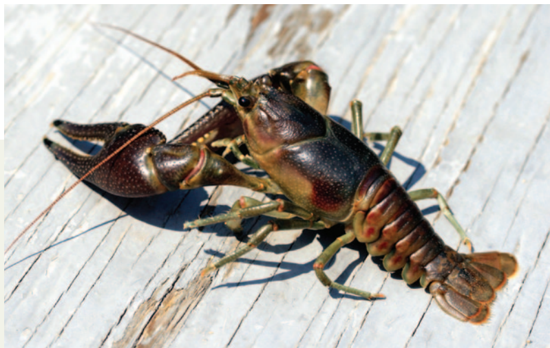
Écrevisse américaine.