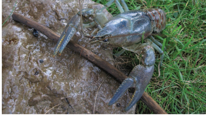
Écrevisse américaine.

© 2012, Imprimeur de la Reine pour l'Ontario This publication is also available in English.