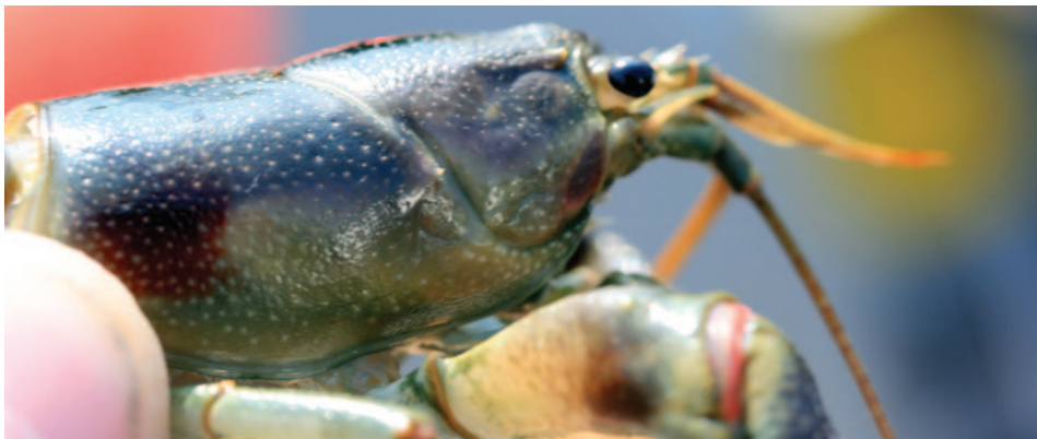
Écrevisses américaines présentant des taches rouille.

Afin d'empêcher la propagation de l'écrevisse américaine, il est interdit en Ontario de transporter par voie de terre toute espèce d'écrevisse, tant vivante que morte. On ne peut utiliser des écrevisses comme appât que dans les lacs où elles ont été pêchées.